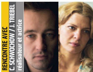
RENCONTRE AVEC C. SCHWOCHOW / J. TRIEBEL réalisateur et actrice

„Eine Geschichte aus dem Land, das wir in uns tragen“ „Une histoire sur le pays que nous portons en nous“