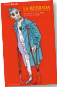
Portada del libro del sobrino de Josep Bartolí. (Actes Sud)

A principios del 39, unos 500 000 republicanos escaparon de España a Francia, cruzando los Pirineos catalanes, en busca de refugio. Entre ellos, soldados republicanos, Brigadas Internacionales y civiles (170 000). Fue uno de los primeros éxodos de los tiempos modernos.