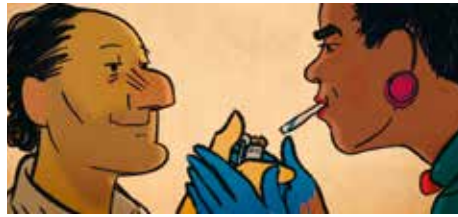
Con Frida Kahlo.

1943-1945 Forma parte del círculo de amigos de Diego Rivera y Frida Kahlo en México. Retoma su actividad pictórica.