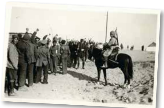
Campo de Argelès vigilado por los Spahis marroquíes.

vigilar a los extranjeros surveiller les étrangers / su internamiento leur internement / al principio au début / el barracón le baraquement / tenían (tener) que devaient / hacían (hacer) agujeros en la arena ils faisaient des trous dans le sable / se aseaban ils se lavaient / pasaban hambre ils souffraient de la faim / los Tiradores senegaleses les tirailleurs sénégalais / eran (ser) constantemente trasladados de un campo a otro étaient constamment transférés d'un camp à un autre / convivían con cohabitaient avec / el obrero l'ouvrier / en el frente republicano sur le front républicain.