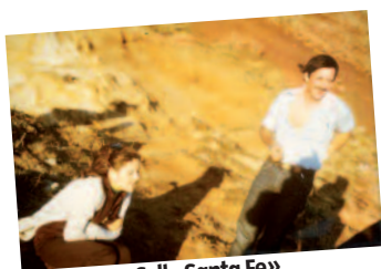
a. «Calle Santa Fe»

Muchas películas de ficción o documentales hablan de las dictaduras latinoamericanas. Relacionar los títulos con los directores.