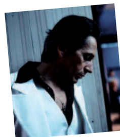
i. «Tony Manero»