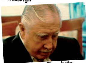
e. «El caso Pinochet»