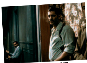
c. «Buenos Aires 1977»