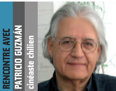
RENCONTRE AVEC PATRICIO GUZMÁN cinéaste chilien

« Creo que Chile tardará cien años en reponerse de la dictadura » « Je crois que le Chili mettra cent ans à se remettre de la dictature »