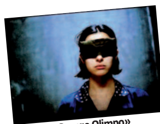
f. «Garage Olimpo»