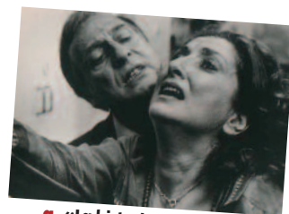
g. «La historia oficial»