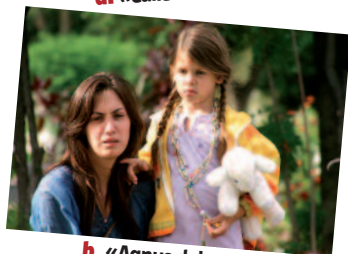
b. «Agnus dei»