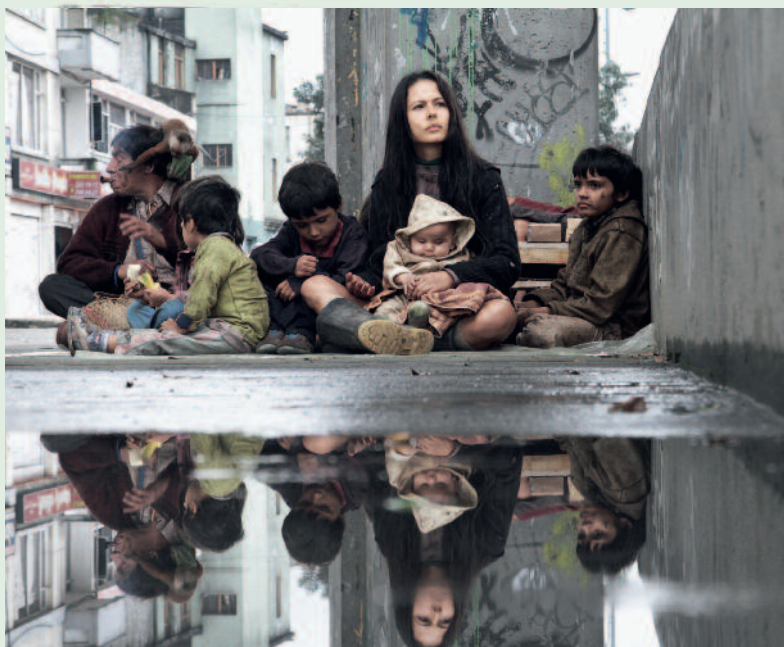
(RAUL SOTO RODRIGUEZ ©2012 ADOZ FILMS - TORMENTA FILMS - ZIROZINE)

pues eh bien / el hogar le foyer / fuera à l'extérieur / dentro de à l'intérieur de / la Consultoría le Conseil / muchos de ellos acaban mendigando beaucoup finissent par mendier.