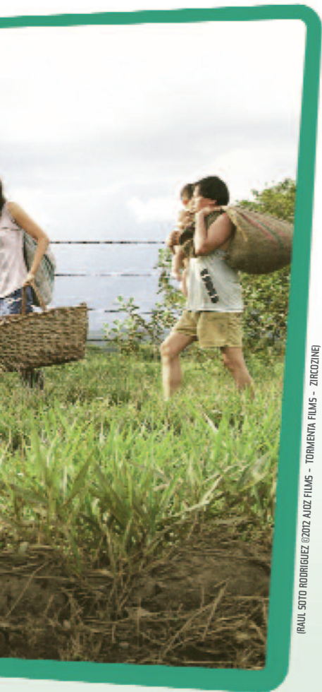
(RAUL SOTO RODRIGUEZ ©2012 ADOZ FILMS - TORMENTA FILMS - ZIROZINE)