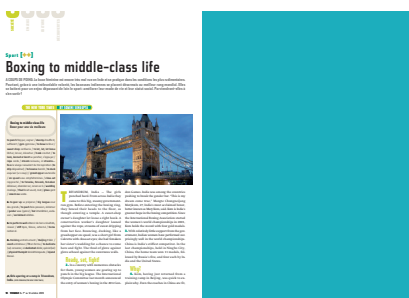
Pleine page 210 L x 287 H