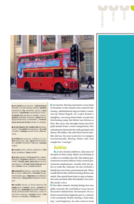
1/3 page hauteur FU 55 L x 230 H