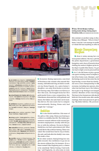
1/9 page FU 55 L x 80 H