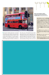
1/2 page largeur FU 176 L x 123 H