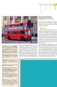
1/4 page FU 118 L x 86 H