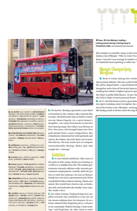
1/6 page FU 55 L x 123 H