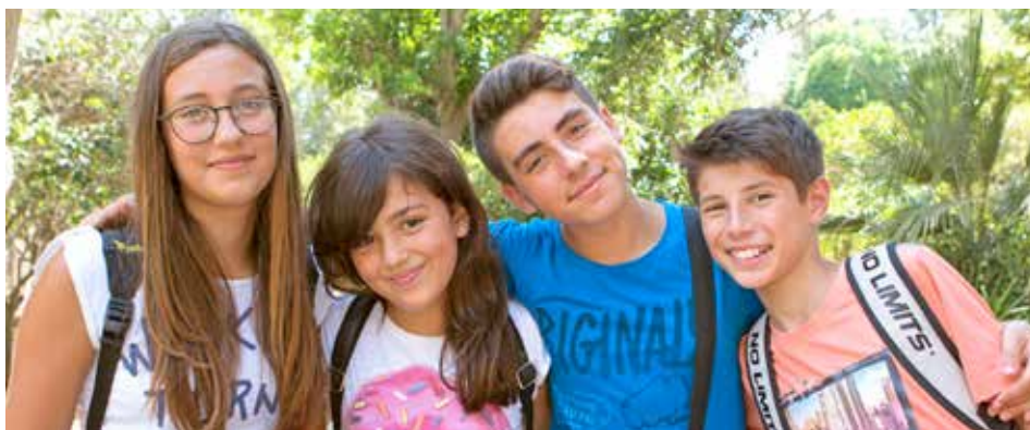
Adolescents partis à Malte. (EC)

S.B. : D'abord, les audits car ils permettent de mesurer le sérieux de l'organisme qui souhaite être accepté au sein de l'UNOSEL. Nous mettons l'accent sur l'éthique des adhérents qui se regroupent pour un partage d'expérience. Un autre point fort également est que l'UNOSEL est signataire de la Charte de la Médiation du Tourisme et du Voyage, ce qui garantit à tous les participants l'indépendance et l'impartialité dans le traitement des dossiers de médiation. Nous respectons les normes européennes et j'insiste sur le fait que nous menons une réflexion continue sur l'évolution de nos métiers : les attentes des apprenants évoluent avec les nouvelles technologies et l'introduction plus précoce de l'apprentissage des langues.